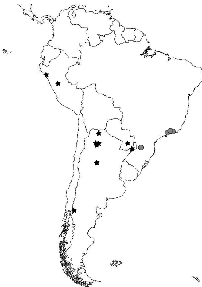
Fig. 7. Distribución de Archytas cirphis en América del Sur. Estrellas negras indican nuevos registros, círculos grises indican registros obtenidos de la bibliografía. Escala = 400 km.

de azúcar. Durante el presente estudio se han analizado ejemplares de ambos sexos obtenidos a partir de pupas de Mythimna sp. (Lepidoptera: Noctuidae) en cultivos de caña de azúcar en la provincia de Tucumán. El dato constituye el segundo hospedador conocido para la especie y el primero conocido de A. cirphis para la región Neotropical. El presente registro representa la tercera especie de Archytas obtenida a partir de hospedadores del género Mythimna , ya que previamente A. pilifrons (Schiner) y A. scutellatus (Macquart) fueron obtenidas de estas polillas (Guimarães, 1977).