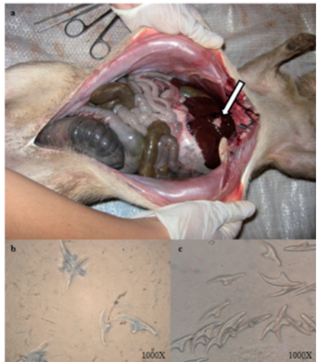
Figura 3 a) Quistes de E. vogeli en hígado de paca adulta, naturalmente infectada. Provincia de Misiones, Argentina. b) Gancho rostral de protoescolices de E. vogeli aislado de paca. c) Ganchos de E. granulosus mostrados en comparación con los de E. vogeli .

En este trabajo se estableció que en la provincia de Misiones hay poblaciones del perro silvestre S. venaticus y del roedor C. paca , este último naturalmente infectado por E. vogeli . Este es el primer informe del hallazgo de este parásito en el país, así como de la presencia habitual de sus dos hospedadores naturales en Misiones. El responsable de la infección humana es el perro doméstico alimentado con vísceras infectadas de las pacas cazadas para la sustentación alimenticia de la población rural. Las poblaciones originarias de Misiones, como las comunidades de Mbyá Guaraní habitantes de la foresta tropical que coexisten con perros pitocos, pueden estar expuestas a los