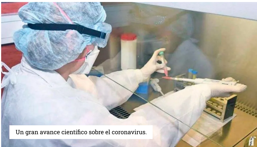
Un gran avance científico sobre el coronavirus.

El ministro de Salud de la Nación Ginés González García publicó en su cuenta de Twitter una microscópica imagen descubierta por científicos del Instituto Malbrán y de UBA Conicet.