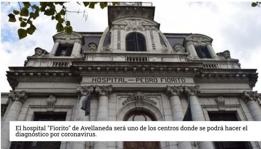
El hospital "Fiorito" de Avellaneda será uno de los centros donde se podrá hacer el diagnóstico por coronavirus.

La Provincia de Buenos Aires amplía la red de laboratorios para poder realizar el diagnóstico de Coronavirus y, ahora, con la incorporación de hospitales y Universidades serán 19 los centros donde se realizarán las pruebas. De esta manera, se podrán efectuar hasta 2.000 muestras diarias lo